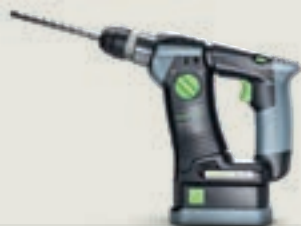
BHC 18 akkus fúrókalapács